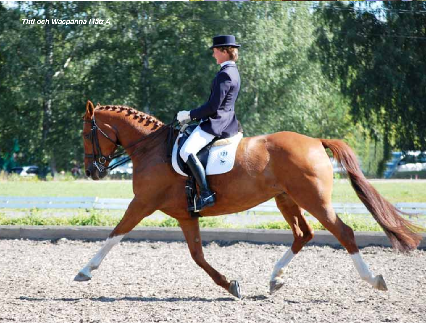
Titti och Wacpanna i lätt A