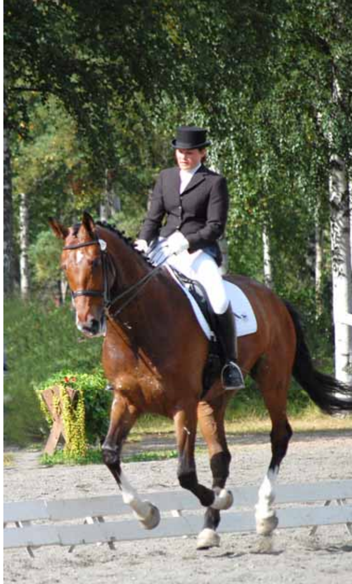
Saga och Pasolini

Först ute i hetluften var Saga och Pasolini. Jag hade lovat vara med vid uppvärmningen och ge några råd vid behov. Vi kunde båda till vår glädje konstatera att Pasolini rörde sig med mycket mera schwung än på kvällen innan. Inne på banan var Pasolini aningen spänd i början och det blev några små skutt då han blev skrämmd. alla rörelser uppförde han fint utan missar och då spänningen släppte blev rörelserna lösgjorda och formen fin i uppförsbacke. Slutresultatet blev hela 64,4%. De må nämnas att den tyska domaren gav nästan 70 % åt Saga och Pasolini! Vi visste att konkurrensen var stenhård så sexa av nio var mer än godkänt.