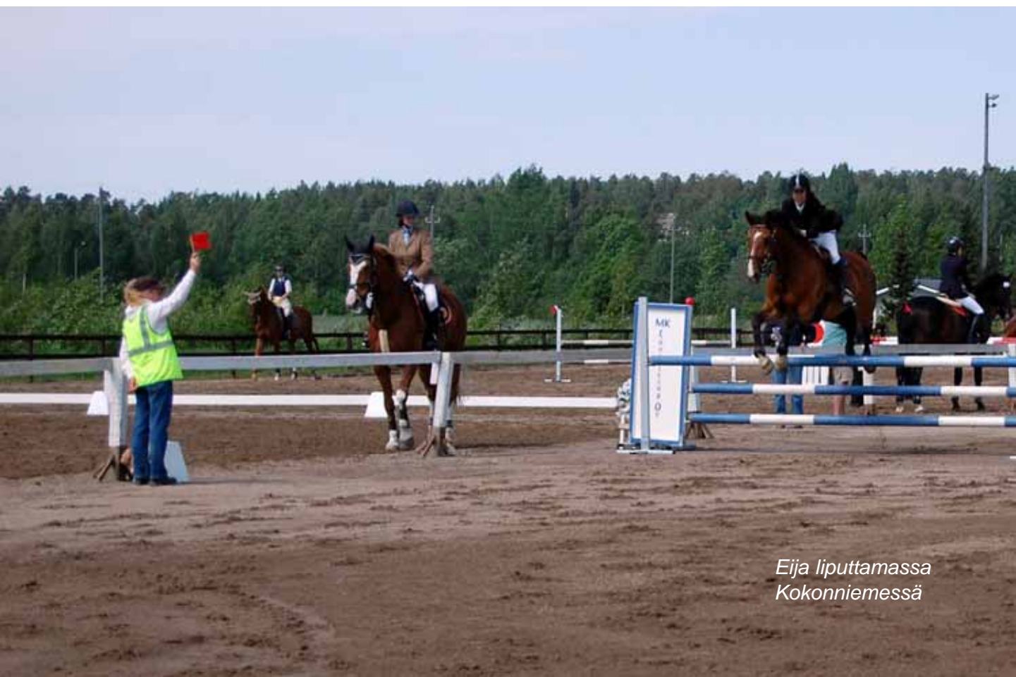
Eija liputtamassa Kokkonniemessä