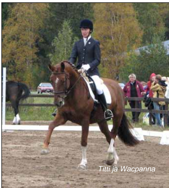
Titti ja Wacpanna