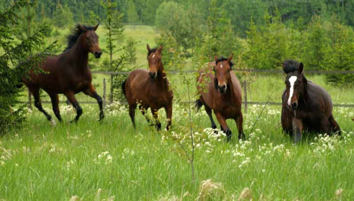
Yllä: Koivumäen Oripojat näyttivät vapaudeta Brusaksen laitumella.