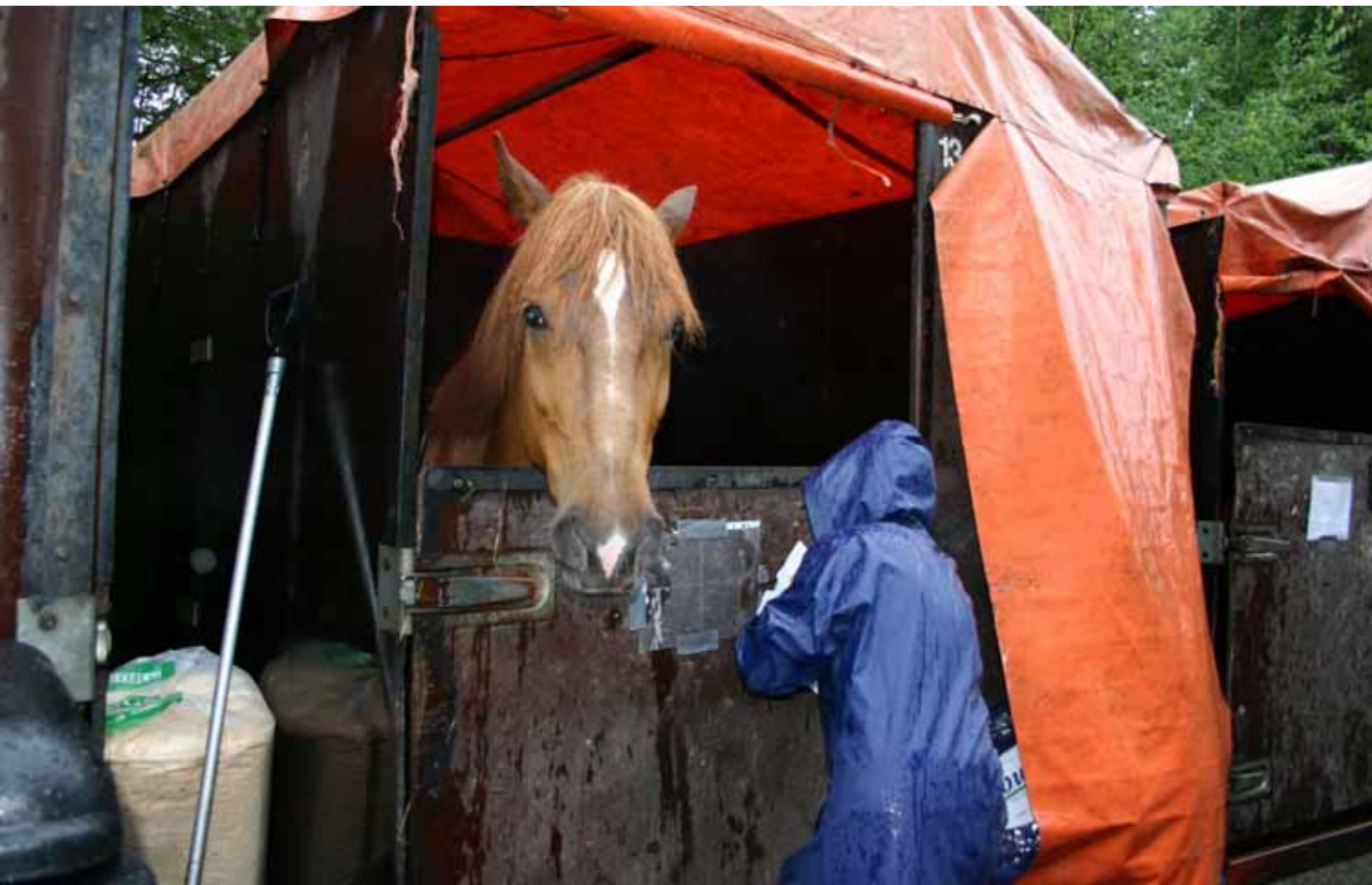
Alla: Kisahevosen arkipäivää kesällä 2008: Kihin Rinssi Jaba-karsinassa sateisessa Muuramessa